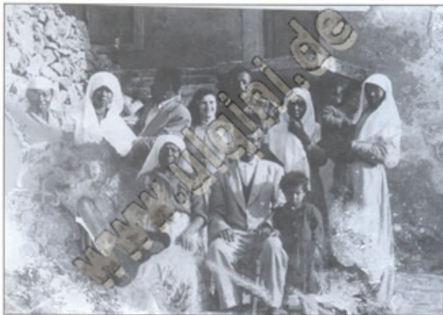
Familje zezake ulqinake (Shurdha) Ulcinjska crnačka porodica (Shurdha) Black family from Ulqini (Shurdha)