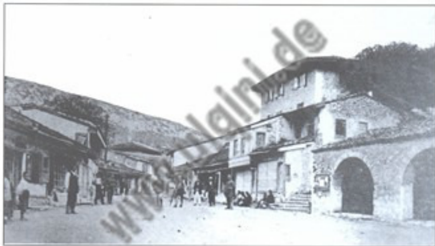
Pjesa e Pazarit të vjetër të Ulqinit, fillimi i shek. XX Dio stare Ulcinjske pijace, početak XX vijeka Part of old market place in Ulqin, beginning of the XX century