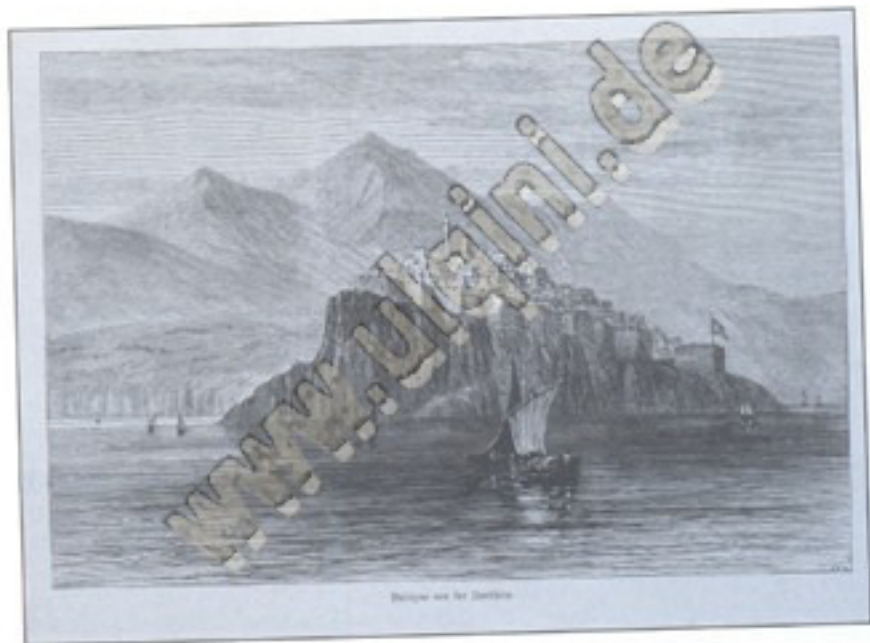
Blick von der Ostseite

Ulqini nga ana veriore, botuar më 1870 në gazetën gjermane "Über Land und Meer". Ulicinj sa sjeverne strane, objavljeno 1870 godine u njemačkom magazinu "Über Land und Meer". Ulqini from the northside, printed in German magazine "Über Land und Meer", 1870.