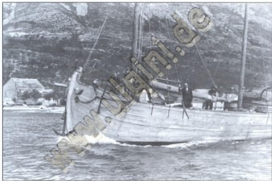
Trabakula "Elbasan", e familjes Shurdha Trabakula "Elbasan", porodice Shurdha Shurdha's family boat "Elbasan"